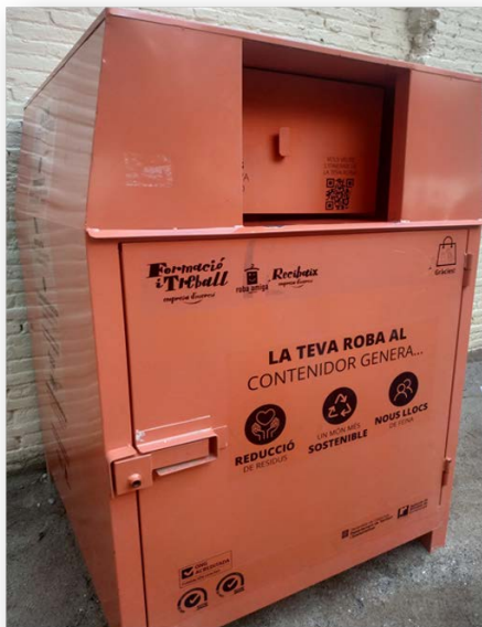
Containerul portocaliu este elementul cheie pentru colectarea deșeurilor textile.

Cooperativa Roba Amiga este formată din diferite entități non-profit care lucrează pentru integrarea socio-productivă a persoanelor cu risc de excluziune socială prin diferite inițiative, precum Roba Amiga.